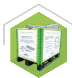
GENBRUGSKASSE OVERSKUD SAMLES I VORES KASSE