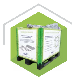
GENBRUGSKASSE OVERSKUD SAMLES I VORES KASSE