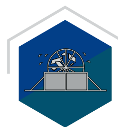
VASK OVERSKUDET VASKES & KVÆRNES TIL NYE PRODUKTER